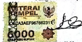
Ido Adi Kurniawan

Surabaya, 2 Februari 2018 Yang membuat pernyataan