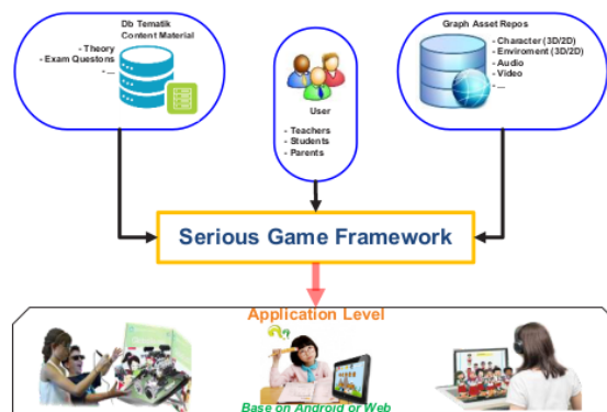
Gambar 1. Desain sistem serious game untuk pembelajaran tematik

Program ini merupakan program yang berkelanjutan dengan target pada tahun pertama bisa menghasilkan platform dan framework untuk running teknologi serious game . Setelah sistem siap dan stabil dalam setiap tahunnya tinggal melakukan update konten dari pembelajaran tematik tersebut. Secara detail desain sistem untuk ide ini adalah seperti Gambar 1.