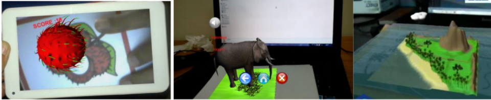
Gambar 3. Beberapa contoh augmented reality untuk pembelajaran anak

Untuk membuat siswa bisa lebih mendalam ketika belajar menggunakan konsep serious game dibuat sebuah fitur virtual reality dalam bentuk augmented reality , sehingga dengan menggunakan peralatan sederhana baik siswa, guru ataupun orang tua siswa bisa menggunakan dimanapun dan kapanpun. Sistem augmented reality ini dalam bentuk garfis 3D, dan tidak semua materi bisa dibuat dalam bentuk 3D juga sistem augmented reality . Sebagai contoh desain augmented reality dalam serious game pembelajaran berbasis tematik seperti Gambar 3. Sedangkan timeline dalam pengerjaan dan implementasi secara detail seperti Gambar 4.