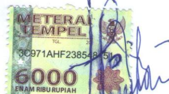
Ratih Novianti Pradini Putri NPM : 16430044