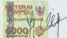
YOPPI RIZALLUL ALFI SULAIMANA