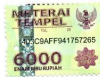
Rati Yustino 15610009