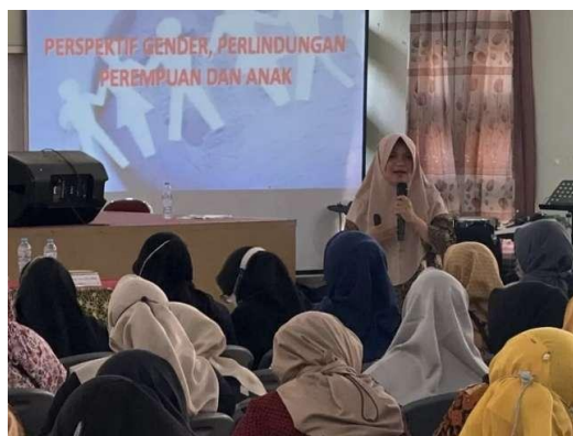
Gambar 4. Kegiatan Training of Trainer (ToT) Sumber data sekunder : Dokumen Puspaga Surabaya

“Kalau kami para fasilitator pernah mengikuti ToT, jadi kami diberikan bekal juga terkait dengan ilmu mengenai pencegahan KDRT, kesetaraan gender, masalah anak, masalah keluarga dan masih banyak lagi lainnya. Total materi yang diberikan ada 9-13 materi. Setiap pertemuan berbeda materi yang disampaikan. Sehingga kami para fasilitator juga mengerti apabila memang ada yang berkonsultasi ke Balai RW..” 37