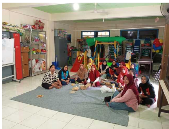
Gambar 3. Kegiatan Sosialisasi Puspaga Balai RW

“Saya mengetahui adanya program Puspaga Balai RW ini melalui sosialisasi pada saat ada pertemuan Arisan. Disana juga dijelaskan bahwa program dari Puspaga Surabaya tidak hanya Puspaga Balai RW melainkan banyak program lain yang juga mendukung pencegahan KDRT seperti yang ada di Instagramnya Puspaga..” 35