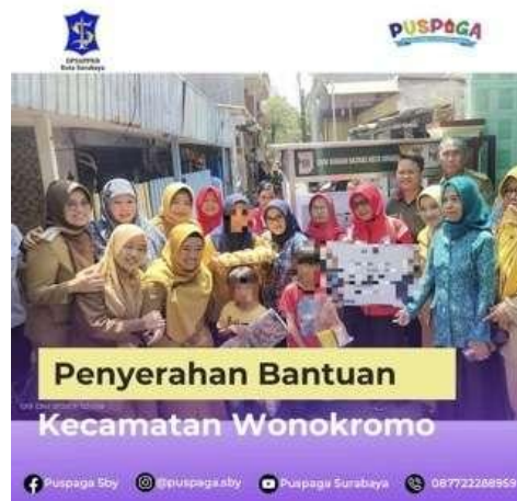
Gambar 7. Penyerahan Bantuan di Kecamatan Wonokromo Sumber data sekunder: Dokumen Puspaga Surabaya