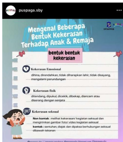
Gambar 6. Postingan Puspaga Surabaya

indikator media sosial dalam implementasi UU PKDRT dalam mencegah KDRT sudah sesuai.