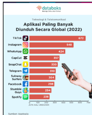
Gambar 1.2. Hasil Riset Mengenai Aplikasi yang banyak diunduh tahun 2022

Berdasarkan data dari perusahaan riset aplikasi, Apptopia, TikTok menjadi aplikasi yang paling banyak diunduh secara global pada tahun 2022. Aplikasi video pendek yang dikembangkan oleh Bytedance ini berhasil mencapai jumlah unduhan sebanyak 672 juta kali sepanjang tahun tersebut, mengungguli aplikasi lainnya dalam persaingan.