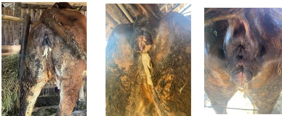
(Foto sapi yang telah di reposisi dan dilakukan penjahitan pada vulva)