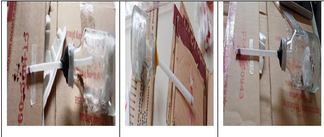
( Gambar 4.2 jumlah jangkrik 1,2,dan 3 ekor dalam setiap botol)

Selanjutnya, dalam menggunakan spirometer siswa juga melakukan pengukuran respirasi dengan membuat percobaan pengukuran respirasi normal dan respirasi ketika selesai melakukan aktivitas kecil seperti lari mengitari kelas, berdasarkan hasil pengukuran kemudian siswa membuat kesimpulan bahwa kapasitas respirasi normal berbeda dengan kapasitas setelah melakukan aktivitas seperti lari, yaitu kapasitas setelah lari lebih besar dibandingkan kapasitas normal sebelum olahraga.