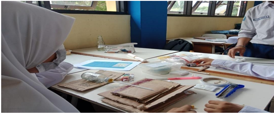
(Gambar 4.1 Contoh keterampilan siswa)

botol dan eosin tidak mudah keluar. Keterampilan yang dimiliki siswa Gambar 4.1 contoh keterampilan menyelesaikan masalah oleh siswa :