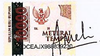
Amelia Wahyu Arista 17420090