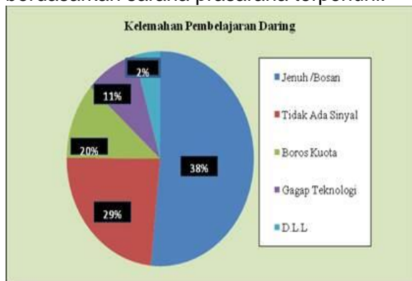
Gambar 2. Kelemahan Pembelajaran Daring

sepantasnya menjadikan kewajiban oleh pemerintah, oleh sebab itu pemerintah harus mewujudkan kebijakan pendidikan sesuai dengan yang diamanatkan oleh undang-undang. Bahwa kebijakan pendidikan adalah kebijakan publik, berkenaan dengan kumpulan hukum atau aturan yang mengatur pelaksanaan sistem pendidikan, tercakup didalam tujuan pendidikan dan mencapai tujuan tersebut (Nugroho, 2008). Kebijakan pembelajaran daring ini sebenarnya bisa dilakukan dengan baik berdasarkan sarana prasarana terpenuhi.