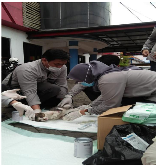
Gambar 2. Pengambilan Darah Kucing

Pada penelitian ini hasil nilai total protein pada kucing liar ( stary cats ) ditemukan ada 11 sampel total protein yang mengalami penurunan dan peningkatan (39%) dan 17 sampel dengan total protein yang normal (60,7%). Dari 11 sampel darah kucing dengan ada 4 sampel dengan nilai total protein yang mengalami penurunan bekisar 4,5-4,7 g/dL. Sedangkan 7 sampel mengalami peningkatan nilai total protein yaitu kisaran 9,1-10,1 g/dL.