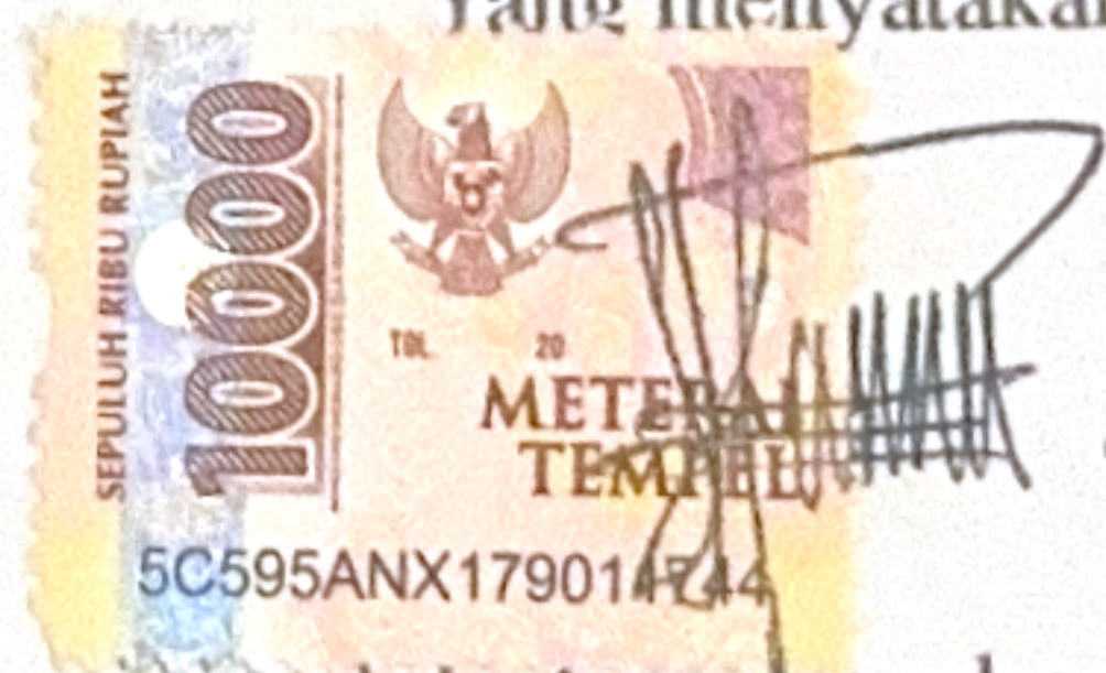
Nabila Aulia Nurahma, S.H. NPM : 24310009