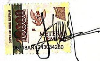
Masfifatul Aini 2261002