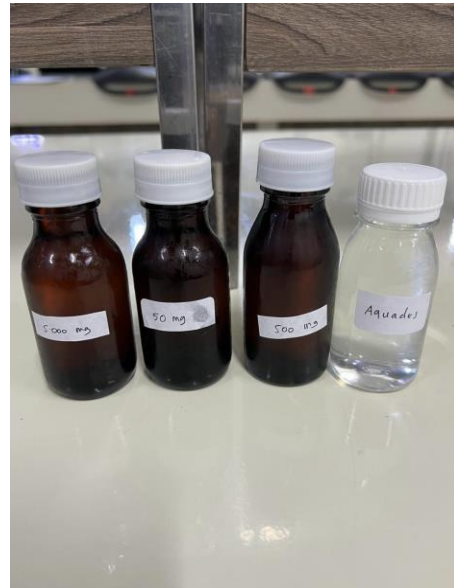
Fermentasi buah berenergi dan aquades