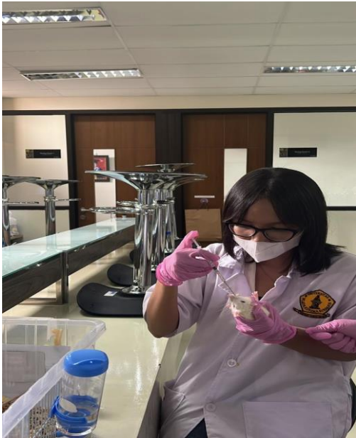
Pemberian Fermentasi Buah Berenuk