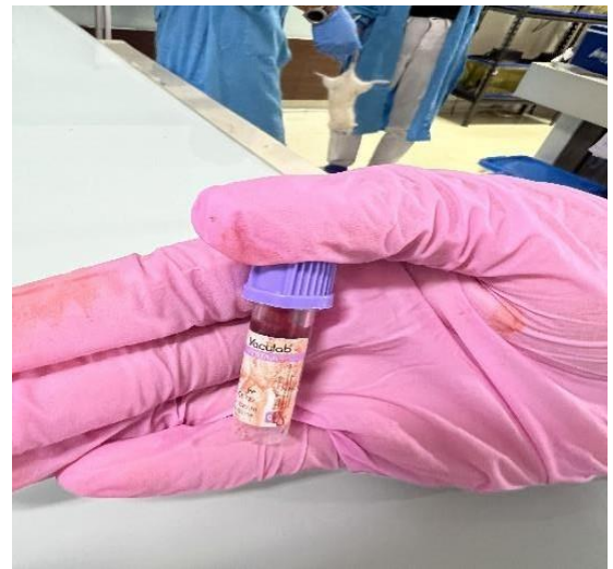
Darah di simpan di tabung EDTA