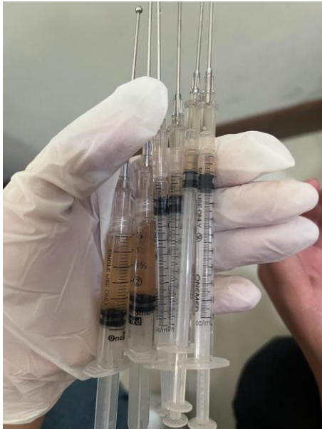
Sprit dan sonde oral