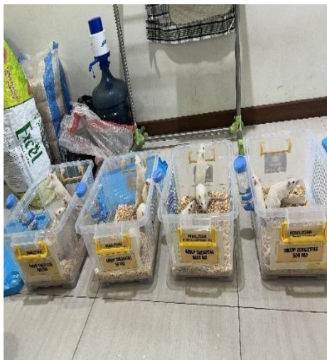
Pembagian kelompok perlakuan