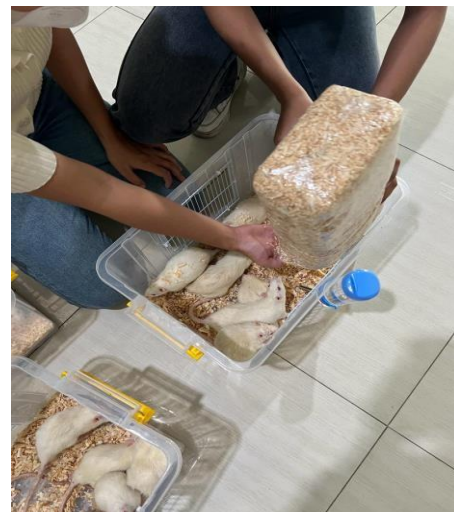
Pemeliharaan Hewan Coba