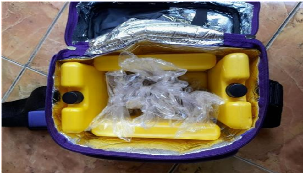
Dokumentasi Puskesmas Jogonalan feses yang telah diambil