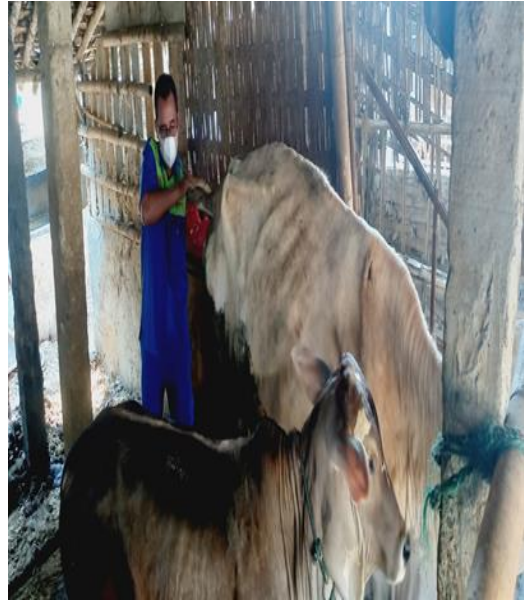
Dokumentasi pribadi pengambilan feses