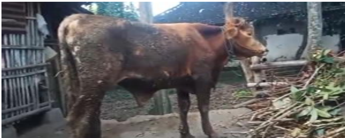
Dokumentasi pribadi sapi yang terindikasi terkena cacing fascioliasis ( fasciola sp )