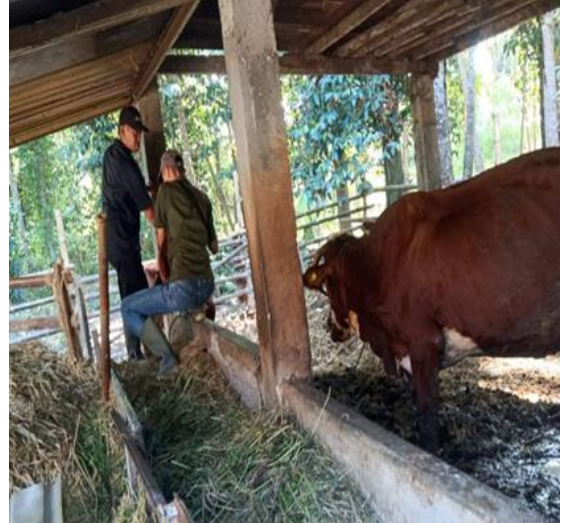
Dokumentasi pribadi. Kandang yang kurang terjaga kebersihannya