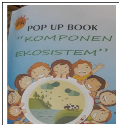
Gambar 2. Pop-up Book yang Dikembangkan oleh Peneliti

Tahap pertama yaitu tahap perencanaan. Pada tahap ini peneliti merencanakan langkah kegiatan secara rinci untuk mencapai pembelajaran yang diharapkan. Adapun tahapan yang dilakukan antara lain: 1) menentukan Kompetensi Dasar dan indikator pembelajaran; 2) membuat perangkat pembelajaran berupa RPP, LKS, Lembar Tes Hasil Belajar Siswa, dan Materi pembelajaran; 3) menyiapkan media pembelajaran Pop-up Book .