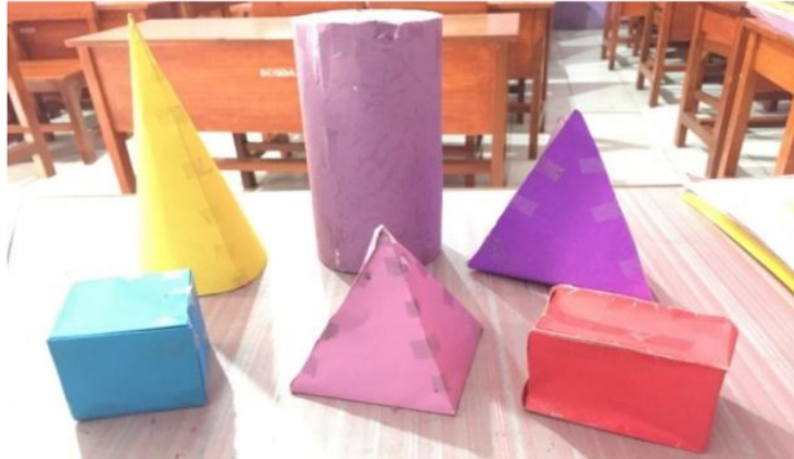
Gambar 2. Macam-Macam Media Tiga Dimensi Bangun Ruang.