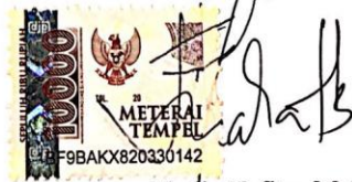
Thalia Hafitsa Mulya NPM 21310009