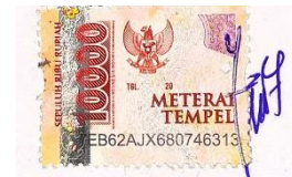
Intan Ramadhani 20430017