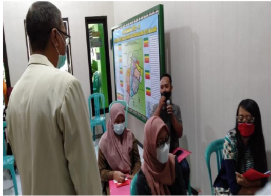
Gambar 2. Sesi Tanya Jawab