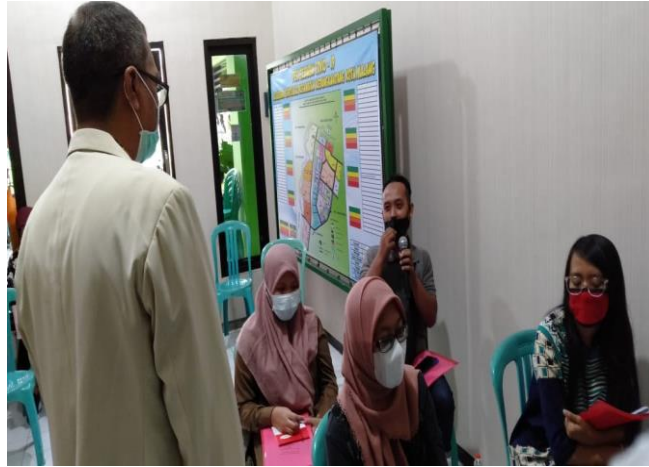
Gambar 2. Sesi Tanya Jawab