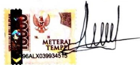
Ajeng Khusnul Khotima 18420055