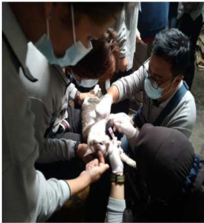
Gambar 1. Pengambilan Darah Kucing