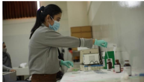
Gambar 2. Pewarnaan ulas darah dengan MDT

Anaplasma sp merupakan parasit darah obligat intraseluler yang dibawa vector kutu Ixodes