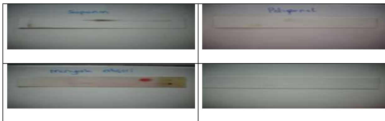
Gambar 1. Hasil identifikasi kandungan kualitatif ekstrak daun Jintan dengan teknik KLT ditemukan positif Saponin, Polifenol, Minyak atsiri dan kumarin

Berikut ini gambar hasil identifikasi senyawa yang terkandung dalam ekstrak daun Jintan dengan teknik Kromatografi lapis Tipis (KLT)