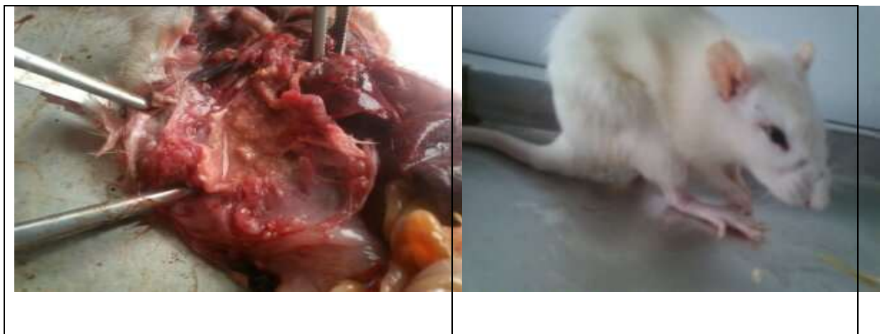
Gambar 2. Adanya penimbunan kristal urea intra peritoneal dan peradangan pada sendi metatarsal kelompok tikus perlakuan yang diinduksi Oxonic acid 1.5 % dan Uric acid 2 % .

Berikut ini gambar patologi anatomi tikus yang diinduksi Oxonic acid 1.5 % dan Uric acid 2 % pada kelompok perlakuan.