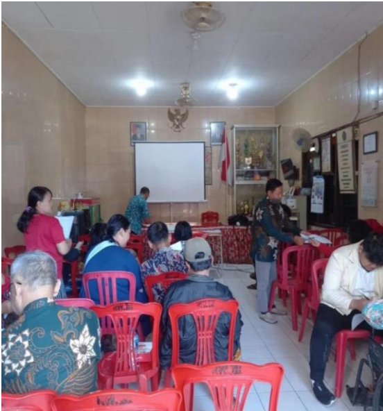
Gambar 3. Pelaksanaan penyuluhan tentang efektivitas vitamin E pada kulit

Hasil data tabel 1 berdasarkan usia menunjukkan bahwa warga RT.03 yang mengikuti penyuluhan 31,43 % berusia 41-55 tahun dan usia 81-90 tahun memiliki 2,9 %. Kelembaba kulit dari warga menunjukkan tidak adanya pengaruh berdasarkan usia, karena dari beberapa warga berusia 60 tahun memiliki kelembaban kuli sebesar 60 %, dan usia 55 tahun memiliki kelembaban 45 %.