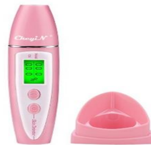
Gambar 1. LCD Digital Skin Detector memiliki adopsi sensor bio-teknologi, menguji kelembaban dan minyak di kulit

Tabel 1 menunjukkan hasil data dari penggunaan alat pengukur kelembaban atau kadar minyak kulit dengan Monitor LCD MR213. Alat ini merupakan LCD Digital Skin Detector yang berfungsi menguji kelembaban dan minyak di kulit. Penggunaan alat LCD Digital Skin Detector sangat efektif karena hasil pembacaannya tidak terlalu terpengaruh oleh kandungan garam dimana kandungan tersebut terdapat pada keringat kita.