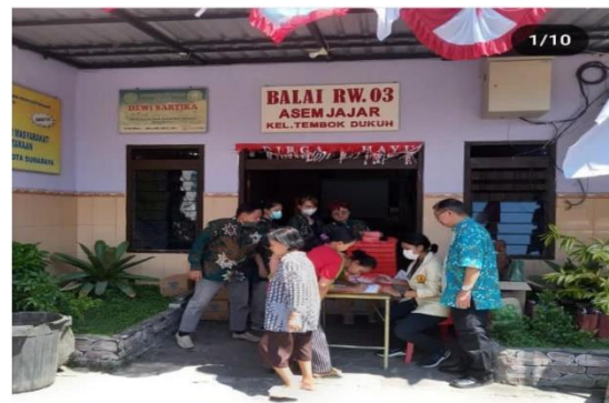
Gambar 2. Mengisi daftar hadir sebelum pelaksanaan pengabdian masyarakat di Balai Asem Jajar RW.03

Dilaksanakannya pengabdian masyarakat dengan memberikan penyuluhan yang diikuti warga yang hadir di Balai RW.03 dapat memahami kelembaban kulit dan manfaat mengkonsumsi vitamin E. Penjelasan yang mendetail membuat warga mendengarkan dengan seksama dan menanyakan hal yang menurut warga tidak paham.