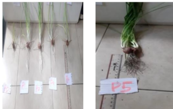
Gambar 2. Pertumbuhan tanaman bawang merah ( Allium cepa ) usia 4 minggu P0 (Kontrol), P1 (ZA Sintetik), P2 (ZAO 75%), P3 (ZAO 100%), P4 (ZAO 150%). Dan P5 (ZAO 170%).

Pemberian ZPT auksin pada tinggi tunas tanaman bawang merah pada awalnya dengan tujuan untuk mempercepat proses pembentukan akar tunas agar lebih bagus dan banyak. Terlihat sekali diusia 2 minggu diparameter 150% dikarenakan pertumbuhan tunas-tunas sudah mulai tumbuh ketika diberi ZPT organik Zat pengatur tumbuh 150% mencapai 4cm ialah salah satunya auksin yang mempunyai daya aktivitas kuat, tetapi dikonsentrasi rendah dapat menginduksi kalus endosperm (Thomas, 2008).