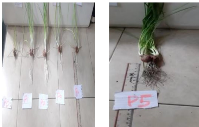
Gambar 2. Pertumbuhan tanaman bawang merah ( Allium cepa ) usia 4 minggu P0 (Kontrol), P1 (ZA Sintetik), P2 (ZAO 75%), P3 (ZAO 100%), P4 (ZAO 150%). Dan P5 (ZAO 170%).

Pemberian ZPT auksin pada tinggi tunas tanaman bawang merah pada awalnya dengan tujuan untuk mempercepat proses pembentukan akar tunas agar lebih bagus dan banyak. Terlihat sekali diusia 2 minggu diparameter 150% dikarenakan pertumbuhan tunas-tunas sudah mulai tumbuh ketika diberi ZPT organik Zat pengatur tumbuh 150% mencapai 4cm ialah salah satunya auksin yang mempunyai daya aktivitas kuat, tetapi dikonsentrasi rendah dapat menginduksi kalus endosperm (Thomas, 2008).