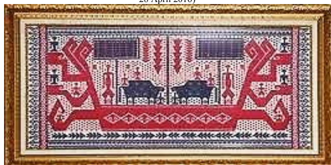
Citra 7. Hiasan dinding yang terbuat dari bahan ulos