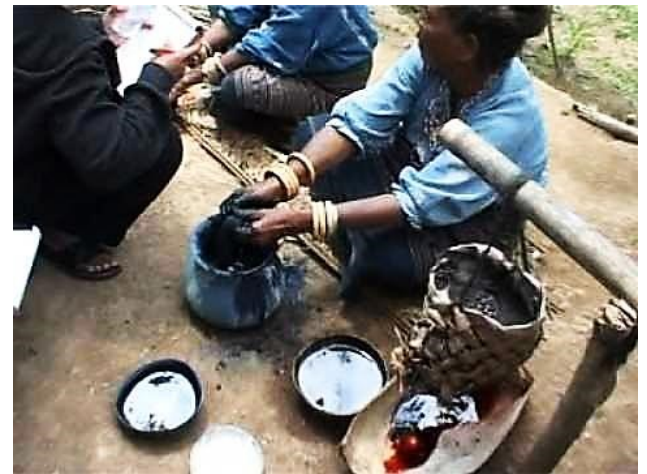
Citra 2. Benang dicelup untuk membuat warna bahan ulos