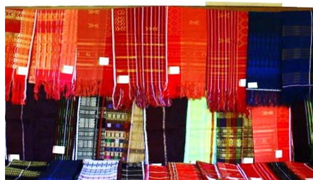
Citra 5. Ulos hasil produksi mesin