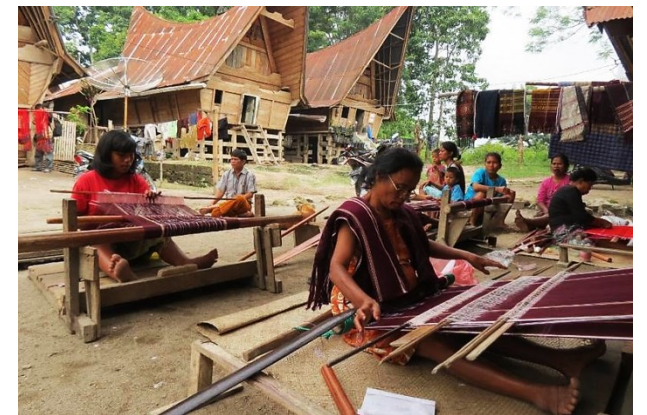
Citra 3. Penenun sedang menenun ulos di halaman rumah secara gotong royong