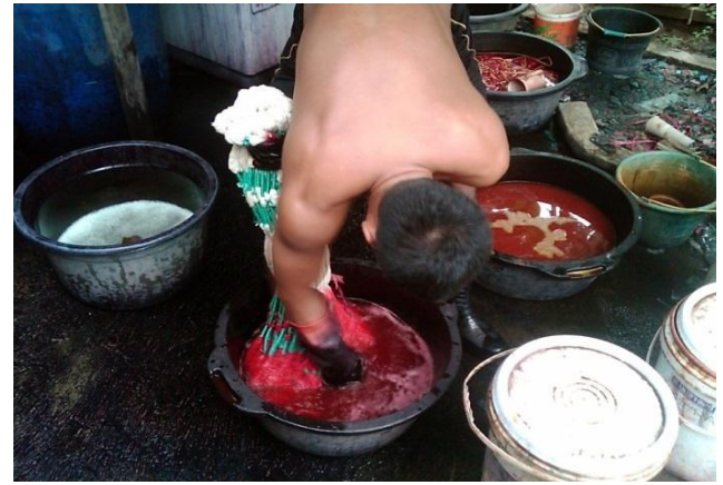
Citra 1. Proses membuat bahan berwarna ulos dari tumbuh-tumbuhan

Ketekunan seorang penenun menentukan lama-tidaknya sebuah ulos selesai dibuat. Di bawah ini merupakan sekilas gambaran proses membuat ulos .