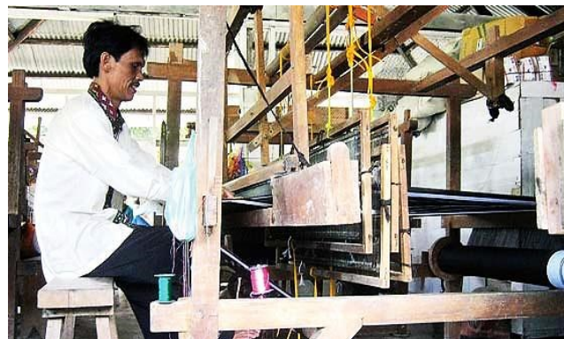
Citra 4. Ulos diproduksi dengan menggunakan mesin

Hal ini sesuai dengan yang dikatakan Adorno bahwa produk-produk kapitalis mendorong terjadinya konformitas dan kesepahaman yang menjamin adanya kepatuhan pada pihak yang berwenang maupun stabilitas sistem kapitalis [7]. Model, warna, ukuran dan lain-lain menjadi haknya kapitalis, hal ini dapat kita lihat seperti di bawah ini: