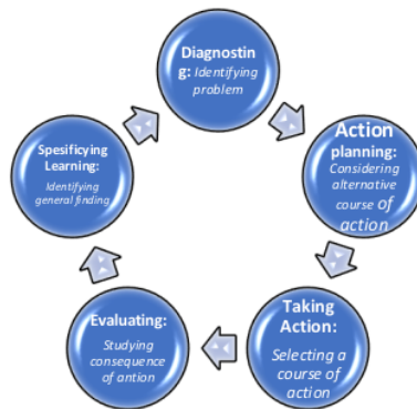
Gambar 1. Siklus Action Research (Susman, 1983)

Karakteristik utama AR adalah: situasional, kolaborasi, partisipatif, focus pada praktek dan self evaluated . Sedangkan ciri-ciri lainnya AR adalah: open minded , terdapat pencatatan data dan refleksi, mengutamakan proses, analisa terhadap apa yang dilakukan, mulai dari masalah skala kecil ke skala besar, memungkinkan untuk berimprovisasi, dan justifikasi terhadap praktek, sebagaimana siklus pelaksanaan AR (Gambar 1).