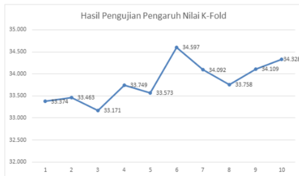
Gambar. 7. Grafik pengujian pengaruh nilai k-fold

Pengujian pengaruh nilai k-fold dilakukan menggunakan nilai k-fold=2 hingga k-fold=10. Pada tiap k-fold dilakukan inputan nilai K=1 hingga K=10. Hasil pengujian pengaruh nilai kfold ini menghasilkan nilai akurasi yang berbeda sehingga dilakukan perhitungan nilai rata-rata untuk mengetahui terbaik. Kesimpulan dari analisis hasil pengujian pengaruh nilai k-fold adalah persentase terbaik terdapat pada nilai k-fold=6 dengan nilai akurasi 34,597%. Pada pengujian tersebut mempunyai hasil nilai k-fold terbaik tidak berada di satu nilai tertentu karena dari hasil grafik menunjukkan persentase akurasi terdapat nilai yang naik turun pada masing-masing kfold. Hasil rata-rata pengujian pengaruh nilai kfold dapat dilihat pada Gambar 7. Berdasarkan pengujian pengaruh nilai K dan pengaruh nilai k-fold tidak terlihat perbedaan yang signifikan dikarenakan data yang berupa bilangan biner. Selain itu, gejala pada data latih tidak menunjukkan persamaan gejala yang dominan meskipun data latih terdapat pada kelas yang sama. Sebaliknya, data latih tersebut terdapat banyak kemiripan gejala sementara data latih tersebut ada pada kelas yang berbeda.