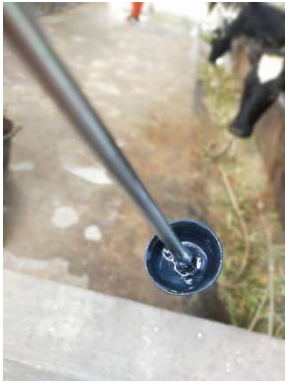
Leleran berwarna keruh (lendir servix)