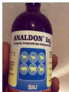
Analdon® -10 ml