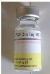
PGF 2α -5 ml