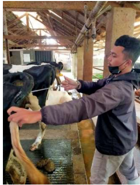
Pemeriksaan lendir servix