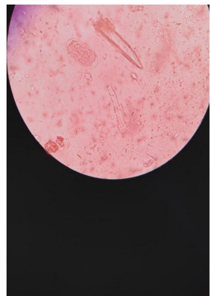
Hasil Pemeriksaan Feses sapi

Foto Kegiatan Pengamatan di Laboratorium Klinik Hewan