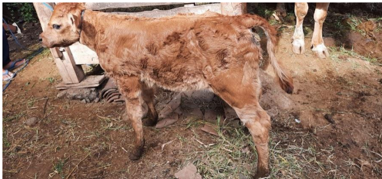
Gambar 6: Pedet mengalami diare