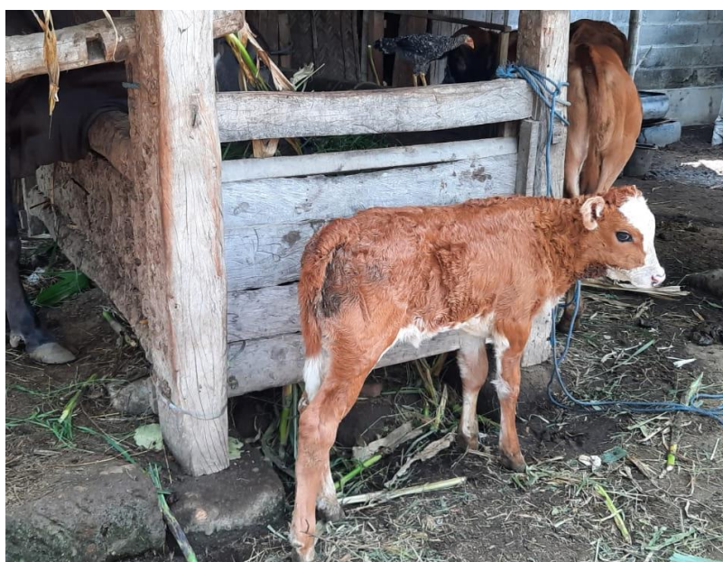
Gambar 4: Pedet yang mengalami colibacillosis