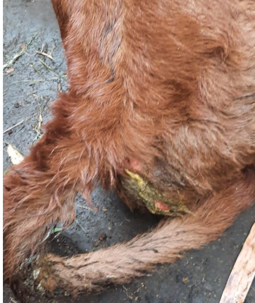
Gambar 1: Pedetumur 1 hari yang mengalami diare