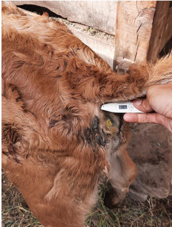
Gambar 5: Peningkatan suhu pedet atau pedet mengalami demam