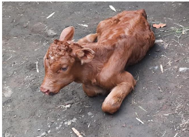
Gambar 2: Pedet mengalami lesu dan dehidrasi