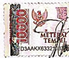
Rizka Iwantfi Anggraini 19430009