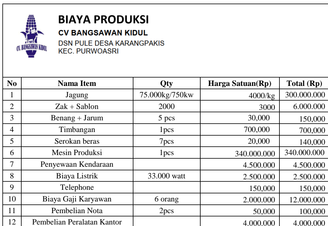
Tabel 4.2 Tabel Biaya Produksi