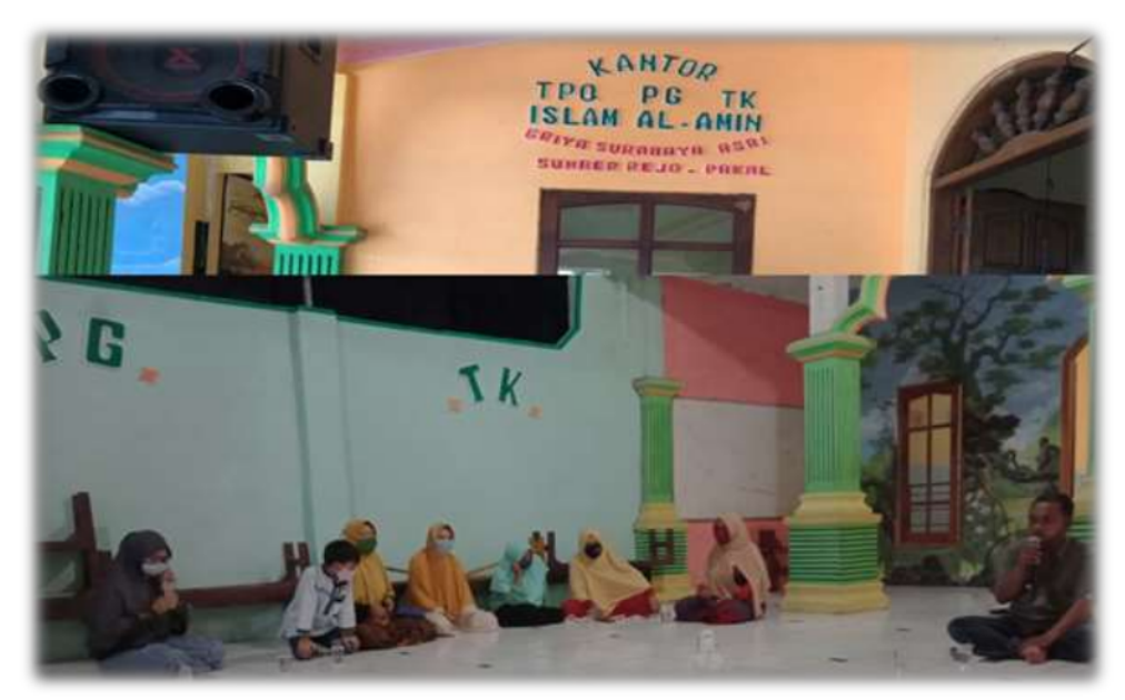
Gambar 1. Peninjauan Lokasi di PG TK Islam Al-Amin

Pengabdian kepada Masyarakat dari Universitas Wijaya Kusuma Surabaya dan peserta aktivitas ini adalah guru-guru dan pengurus sekolah yang terlibat dalam manajemen sekolah PG TK Islam Al-Amin. Pada Gambar 2 ditampilkan suasana pada saat dilaksanakannya penyuluhan.