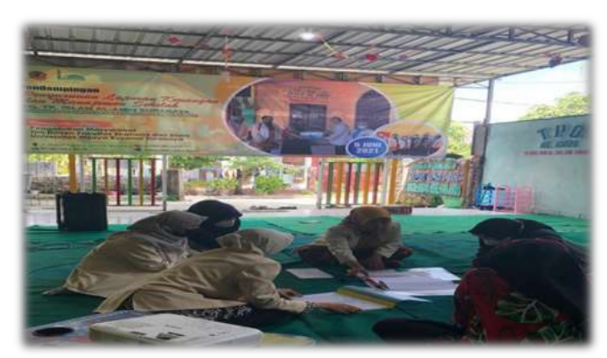
Gambar 3. Pelaksanaan Evaluasi