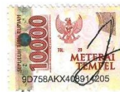
Isna Nur Fatimah 15410057

Surabaya, 15 Januari 2023 Yang membuat pernyataan,