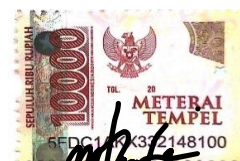
Rindi Wulansari NPM : 19430029