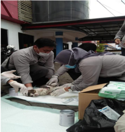
Gambar 2. Pengambilan Darah Kucing

Pada penelitian ini hasil nilai total protein pada kucing liar ( stary cats ) ditemukan ada 11 sampel total protein yang mengalami penurunan dan peningkatan (39%) dan 17 sampel dengan total protein yang normal (60,7%). Dari 11 sampel darah kucing dengan ada 4 sampel dengan nilai total protein yang mengalami penurunan bekisar 4,5-4,7 g/dL. Sedangkan 7 sampel mengalami peningkatan nilai total protein yaitu kisaran 9,1-10,1 g/dL.