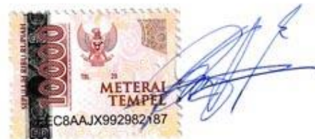
VICTOR PRANATA NPM. 18430036

Surabaya, 21 Agustus 2022 Yang membuat pernyataan