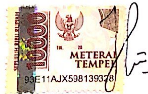
LEVI FERNANDA TAALUNGAN